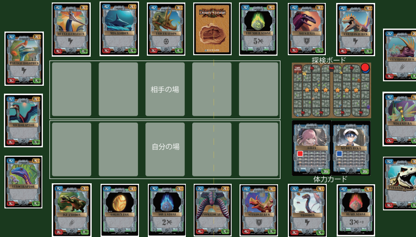
ゲーム準備時の配置例

考古学者でもあり科学者でもあるあなたは、古代生物の化石を発掘、再生し、珍しい恐竜などを披露することで学者としての栄誉を稼ぎ、時には生物を戦わせ強さを競います。 相手プレイヤーの体力を0にするか、2人のプレイヤーがゴールにたどり着き、ラストバトルを終えたのちに、より多く得点を稼いでいたプレイヤーの勝利です。 (得点はメモ帳や得点カウンター等でカウントしてください。)